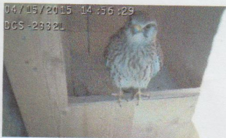
Erster Augenschein vom Nistkasten

Mit dem Einbau von 2 weiteren Dohlenkästen, musste die Dohlen-Kamera gezügelt werden. Neu zeigt sie den Einblick in ein gegen Koblenz gerichteten Nestes.